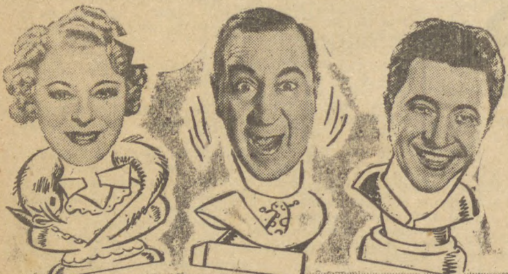
MARY BOLAND HUGH HERBERT FRANK McHUGH