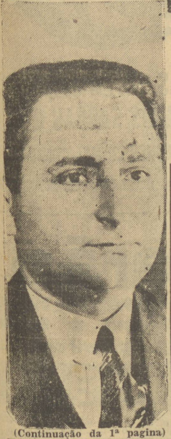
(Continuação da 1ª pagina)