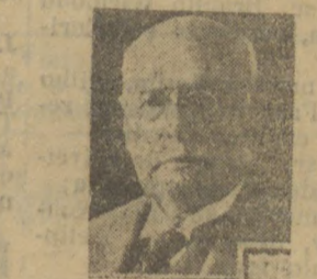
Sr. Olegario Maciel

BELLO HORIZONTE, 27 — O governo mandou abrir concorrência para a feitura do busto do presidente Olegario Maciel.