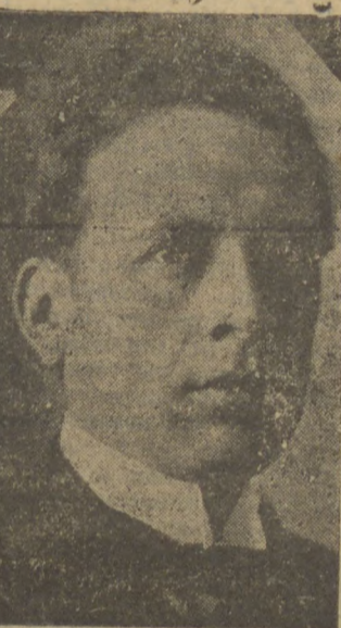
Sr. Flores da Cunha

PORTO ALEGRE, 27 — Está sendo esperado, até o dia