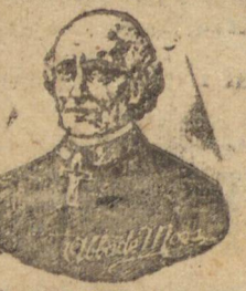
Abbade Moss se traduz no desaparecimento desses sofrimentos.

Todo este cortejo de sofrimento se reúne num mal único — Desordens no Aparelho Gastro intestinal, desorienta o doente, atormenta-o nas horas de prazer ou durante o sono, quando consegue dormir. A ação direta e eficaz sobre o Estômago, Fígado e Intestinos que exercem as pilulas do