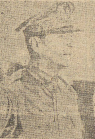
General Mac Arthur

Mac Arthur ditará os termos de rendição ao Japão guardada hoje a declaração da capitulação