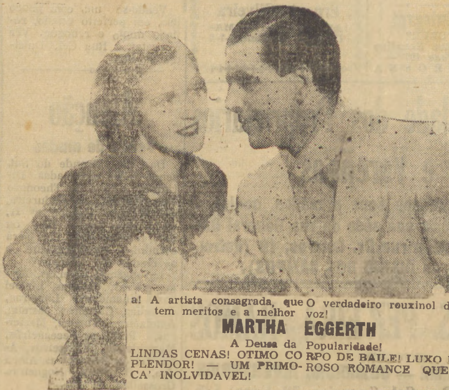
a! A artista consagrada, que O verdadeiro rouxinol da tél tem meritos e a melhor voz!