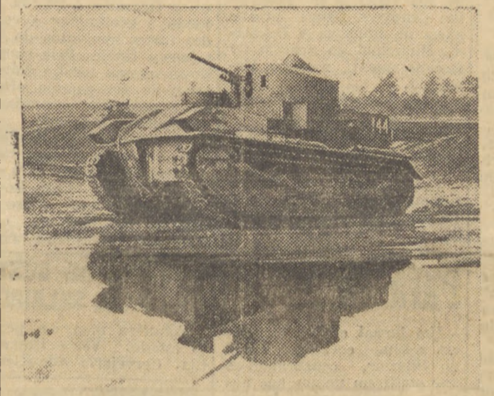
Tipo de velocissimo carro de assalto do exercito do Reich

PARIS, 24 (B.B.C.) — O avanço alemão que projeta-se de Flandres, em direção ao mar, está em perigo, em