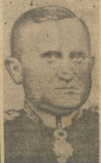
Gen. Gaspar Dutra

executaram o Hino Nacional e os canhões alinhados desde a frente do Automovel Clube