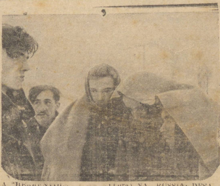
A “REINENKOLN” (LITORAL) NA RUSSIA: DESALMENTADOS PRISIONEIROS GERMANICOS FEITOS PELOS SOVIETS — Um grupo de prisioneiros de guerra alemães, capturados algures ao longo da imensa linha de frente russa. Insuficientemente animados e desesperados, esses prisioneiros refletem as esperanças desvanecidas de uma vitória germanica.

Nos setores de Moscou e de Leningrado também se combateu furiosamente. Segundo os despachos militares, os alemães empreenderam essas operações não como ofensiva, mas para deter os russos, afim de impedir que os mesmos enviem reforços importantes à frente da Ucrania.