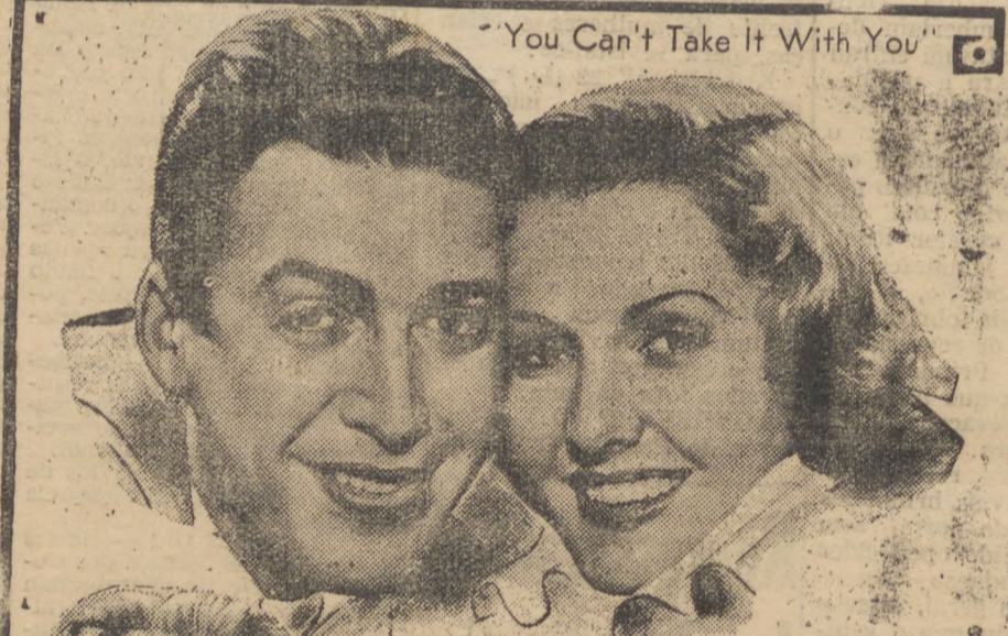
"You Can't Take It With You"

com JAMES STUART Jean ARTHUR Lionel BARRYMORE