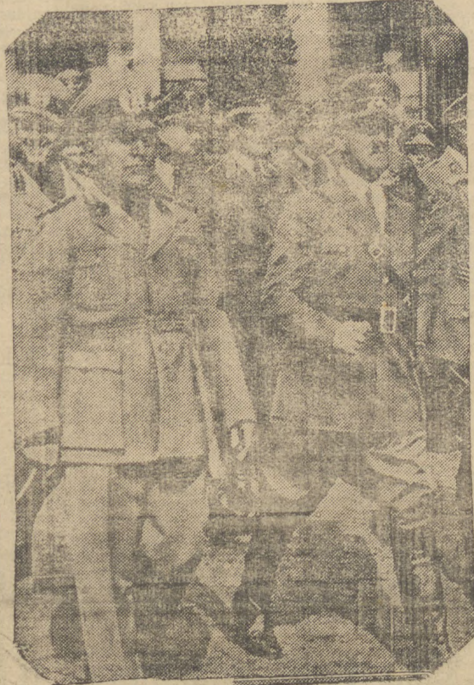
RIO, outubro (Diário) — Foi noticiado, através do serviço telegrafico, que Hitler e Mussolini teriam marcado encontro no qual estudariam a situação futura da Europa. Na fotografia vemos os dois chefes quando Hitler visitou a Peninsula.

LONDRES, 16 (D.) — Por engano, foi dado hoje na cidade de Leeds, o alarme de explosões aéreas. Centenas de habitantes procuraram imediatamente os refúgios. Pouco depois, no entanto, a cidade recobrou o seu aspecto normal.