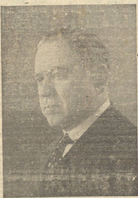
INTERVENTOR MANUEL RIBAS

Não fora a ampla e fecunda visão dos fatos, a acuidade na interpretação dos acontecimentos, a longa experiência que trouxera para o governo, o desejo firme de acertar, a intima convicção de que qualquer tarefa de renovação exigia total mobilização de energias reconstrutivas, de recursos e de meios, a formação pragmática de sua personalidade, o realismo de suas conclusões e ações, e o interventor Manuel Ribas, logo que assumiu as responsabilidades do governo do Paraná, ao perceber a complexidade das tarefas a cumprir, talvez se perdesse em soluções ideológicas, e concorresse para agravar a crise então impenhante e nada produzisse de substancial e duradouro, capaz de subtrair do Estado da terrível conjuntura de baixa em que se debatia e a que fora