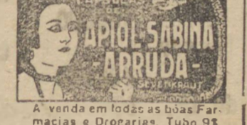
A venda em lojas das boas Farmacias e Drograrias. Tubo 95

As CAPSULAS SEVENKRAUT (Apol-Sabina-Arruda) tem o seu grande êxito assegurado pelo rigor científico que preside ao seu preparo bem como a pureza de elementos empregados na sua composição química.