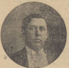
O EX-CHEFE VERDE EM PONTA GROSSA