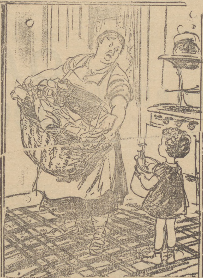
"Meu trabalho era supportavel aqui antes de você chegar..."

Faça uma estação na fonte de Agua Dorizon. Bom hotel, instalações modernas, conforto e hygiene.