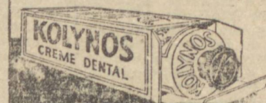
EMBELLECE seu SORRISO com KOLYNOS