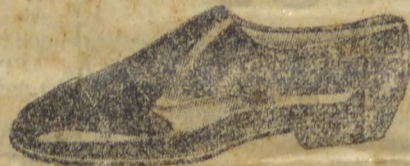
ROCHA (Referencia 4301). Em verniz preto, artigo finissimo para passeios e soirées