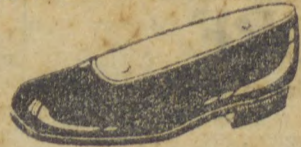
Superior, verniz preto forrado de branco, salto de sola baixo, bom acabamento; de 32 a 40. 19$000