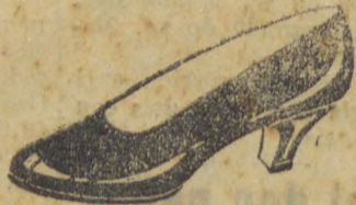
Offerta especial: Superior pellica preta envernizada, forrado de branco. Salto Luiz XV cubano alto e 4 de altura, de 32 a 40. 28$000