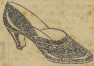
Superior verniz preto, raso, moderno, com picote ao redor da gasnia; forrado de branco. Salto Luiz XV cubano, alto, 32 a 40. 29$000

Calçados mexicanos Em todas as cores 20% menos do que em qualquer outra casa