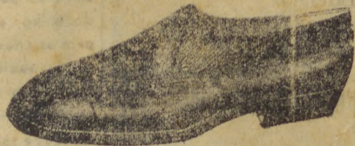
INGLEZ Pellica preta, raso, com elastico. Referencia: 1010

O lemma da casa é Vende barato para vender muito