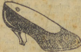
Raso em verniz preto. Todo picotado e forrado de branco. Salto Luiz XV. Mesmo modelo em pellica preta finissima. 30$000