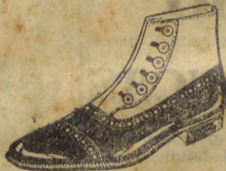
ROCHA. Botinas de abotonar ao lado. Gaspia, marrom e preta, latão, cinza e bege.