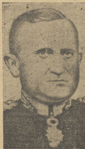
GAL. GASPAR DUTRA, Candidato do partido situacionista a presidencia da República

brigadeiro. RIO, 13 (P.P.) — O general Dutra recebeu hoje, à noite, a reportagem local. Declarou que não podia conceder entrevista porque falava aos jornalistas dentro de breves dias na reunião coletiva. Insistiu, e o ministro da Guerra declarou que recebeu o lançamento de seu nome, como