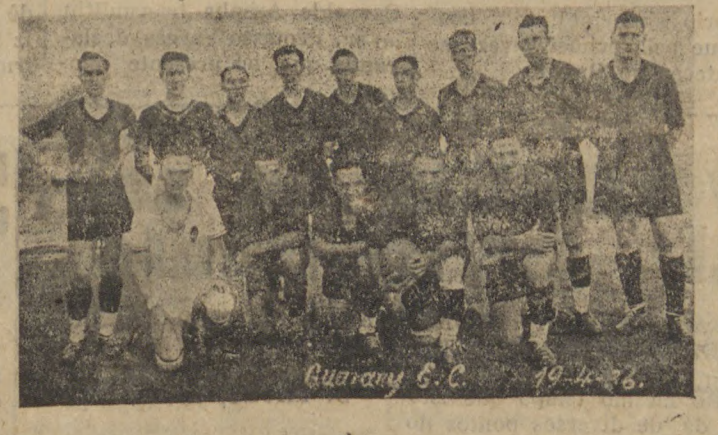
Guarany S.C. 19-4-36

e o Guarany, os catharinenses não estavam em condições de desfazer as perigosas carregadas da melhor linha de frente de que dispõe Ponta Grossa, — a mesma que derrotou, pouco tempo atrás, de