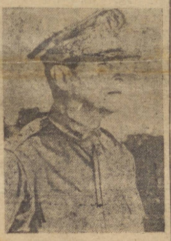
GAL. MAC ARTHUR

Aviões militares e navais norte-americanos, apoiando as forças terrestres continuaram hoje seus tremendos ataques contra as principais bases japonesas. Aviãos militares destruíram 61 aviões japoneses no aerodromo de Clark-Field.