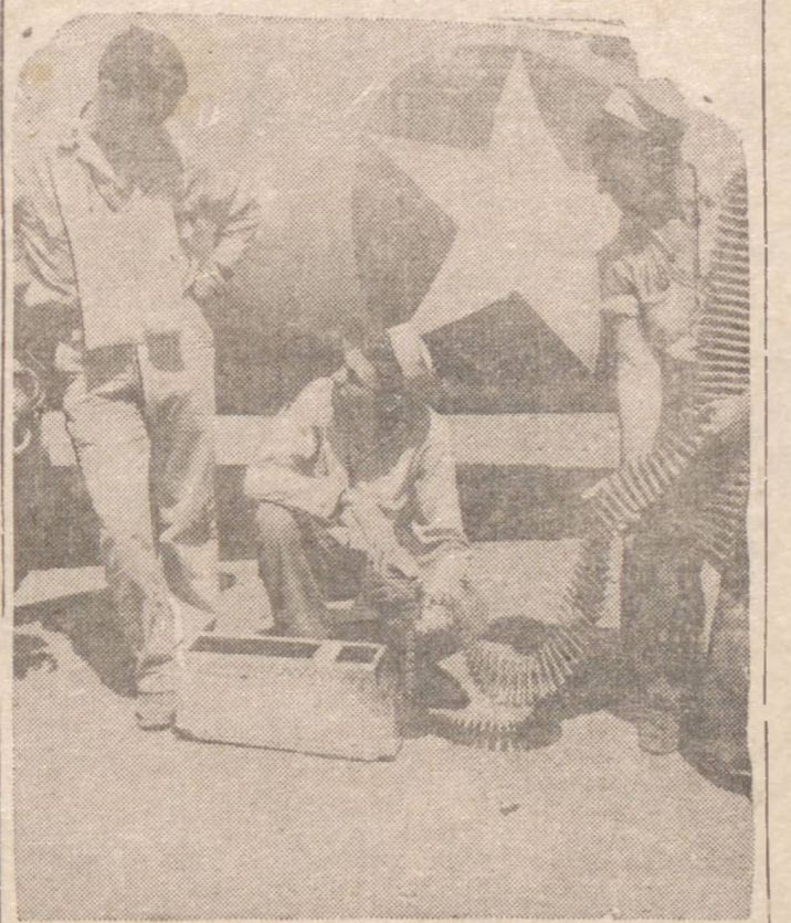
AVIADOR HEROICO — No "cliché" aparece á esquerda o capitão Joseph Poes, "as" da aviação dos Estados Unidos, que até agora já derrubou 26 aparelhos japoneses em combates aéreos na região do Pacífico — (Foto da Inter-Americana).