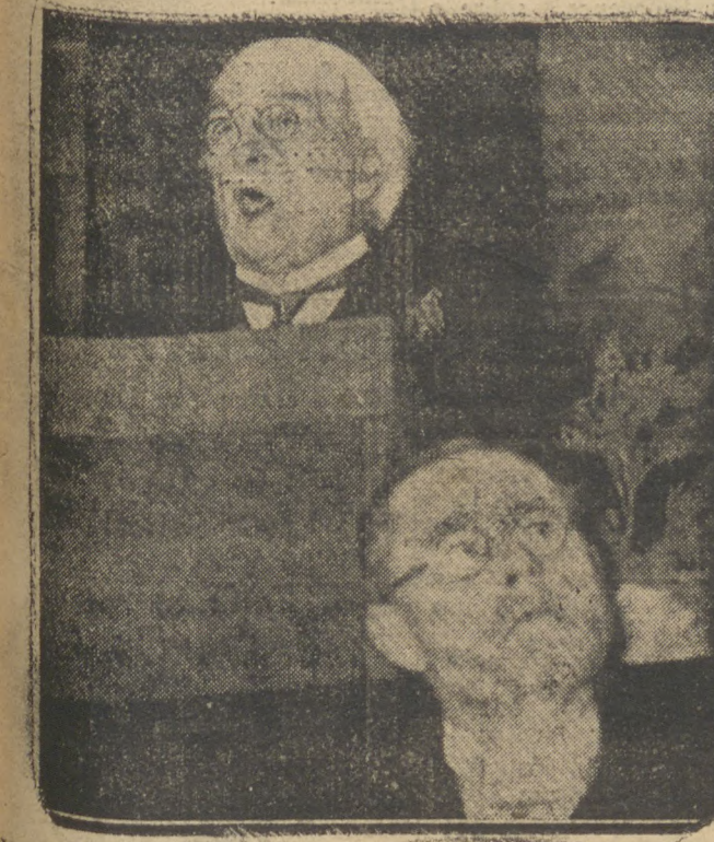
Lloyd George (o de cima) falando numa conferencia politica

DECLAROU QUE NÃO SE DEVE MENDIGAR A PAZ!