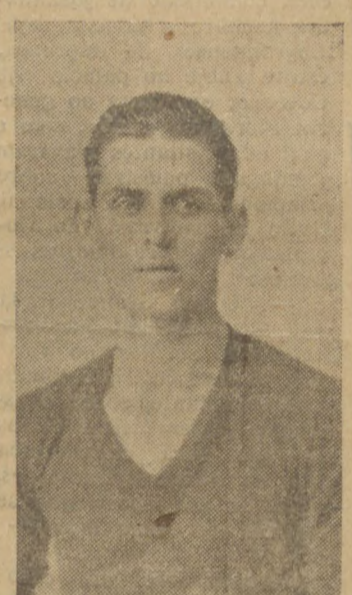
Quilaço, o commandante do quadro bugriño.

A PRELIMINAR Farão a preliminar da tarde, os fortes segundos