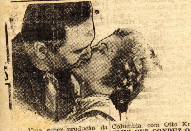
Uma super produção da Columbia, com Otto Krue e Harrigan. A HISTORIA DE UM FILHO QUE CONDUZ O P...