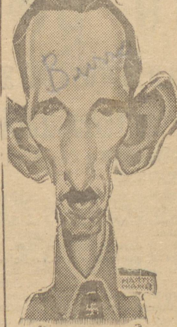
PLÍNIO SALGADO, que traiu o Brasil, pretendem entregar-lo à Alemanha

afastar da luta. Pretendem desagregar nossa férrica Unidade de ação na luta pela Liberdade.