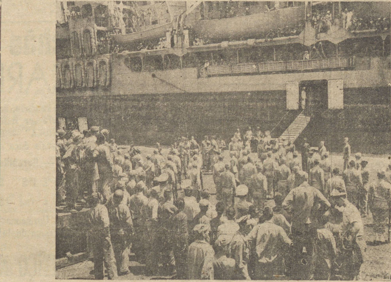
EMBARQUE DAS FORÇAS EXPEDICIONARIAS BRASILEIRAS NA ITALIA.