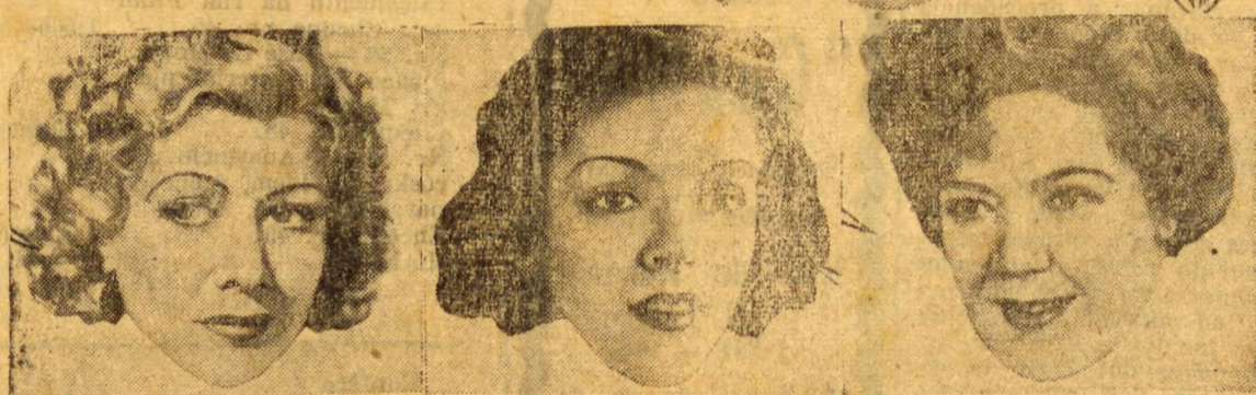
GLADYS GEORGE · JEFFREY LYNN · GALE PAGE