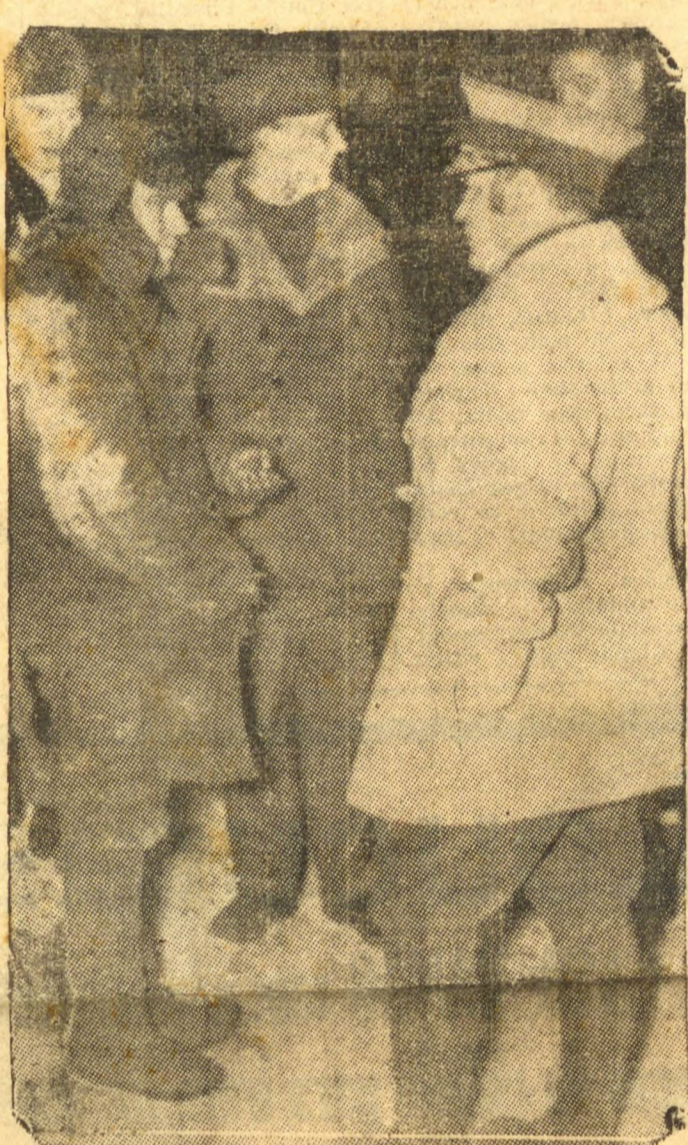
O general finlandês Vallenius, (Foto da revista francesa "L'Illustration", transportado de Paris para o Brasil, pela "Air France").

Os finlandeses avançaram 45 quilômetros em direção a Salla — Operarios suecos irão trabalhar nas industrias da Finlândia