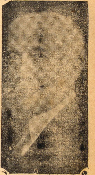
plio por numerosos vultos politicos de todos os pontos do paiz, recommendando a candidatura do Presidente da Camara, á successão do sr. Getulio Vargas.

de que dentro de 48 horas apparecerá um Manifesto ao eleitorado nacional, subscri-