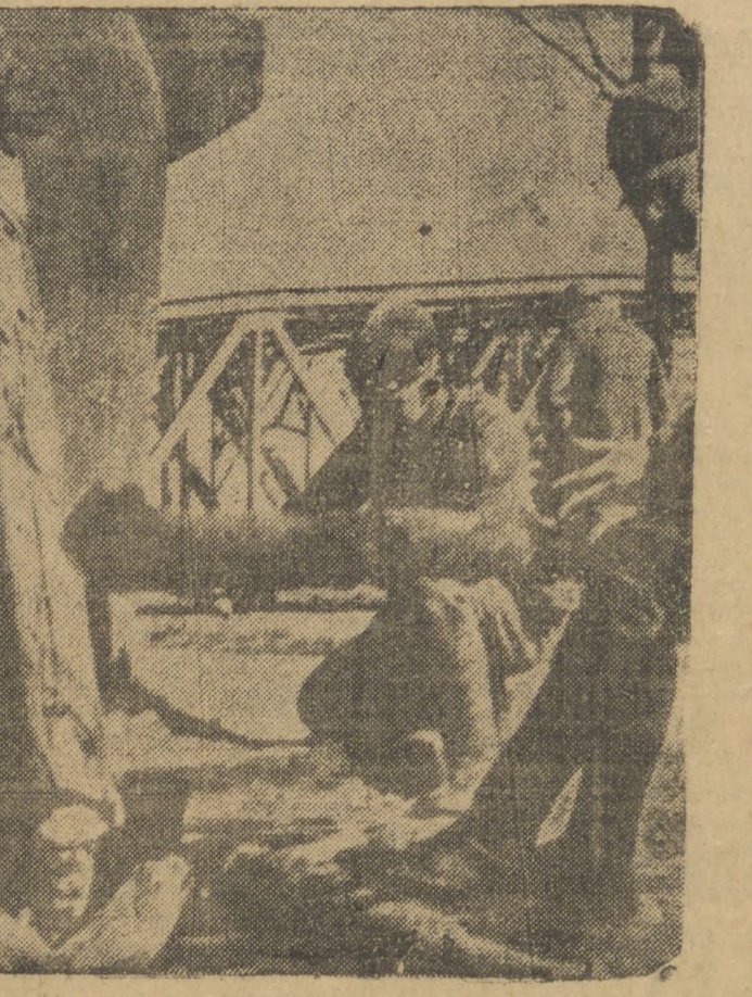
TRABALHOS DE DEFESA NA FRONTEIRA BELGA

AMSTERDAM, (T. O., agencia alemã) — A imprensa holandesa discute durante os ultimos tempos fervorosamente a questão sobre se seria aconselhavel efetivar uma aliança entre a Holanda e a Belgica no caso do territorio de um desses países fosse violado por uma nação beligerante. O "De Standard", jornal intimamente ligado ao antigo primeiro ministro dos Países Baixos, sr. Colijn, rejeita o projeto de uma aliança militar entre as duas nações, dando as seguintes cinco razões para justificar a sua opinião: 1º — Um pacto militar entre a Belgica e a Holanda por certo causará má impressão tanto entre os países neutros como os beligerantes; 2º as condições de um pacto são desiguais para os dois Estados, desde que a Belgica, renunciando as obrigações de Loimpostas pelo pacto de Locarno, permitiu as garantias oferecidas primeiramente pe-