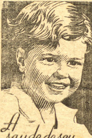
A saude de seu filho