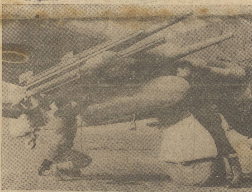
Na fotografia, mecânicos da R. A. F. adaptam projeteis-foguete a um avião em operações sobre o território inimigo.