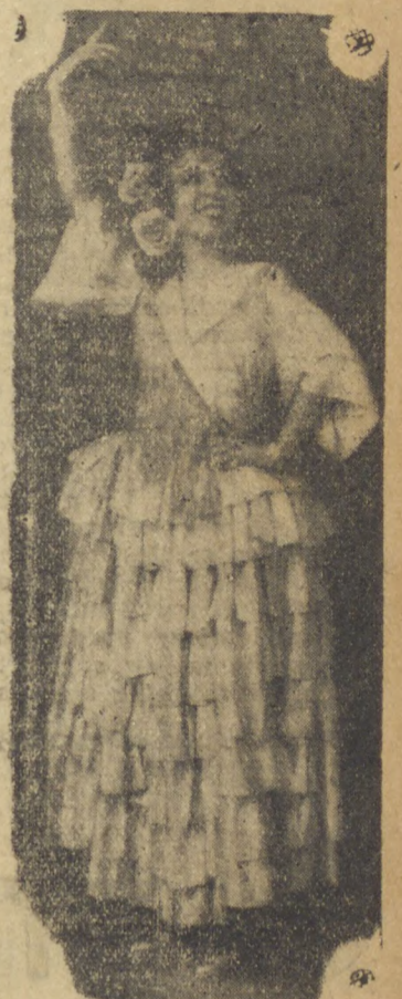
HOJE — HOJE Novos numeros pela famosa bailarina e cantora hepanhola — CARMENCITA — Sucesso Absoluto