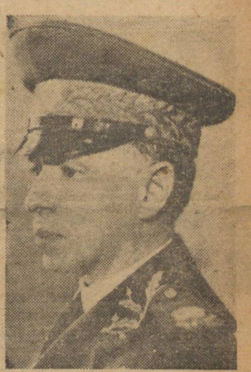
GAL. MENDONÇA LIMA

CURITIBA, 15 (Telo telefônico) — Segundo estamos seguramente informados, deverá visitar o nosso Estado, dentro em breve, o general Mendonça Lima, Ministro da Viação.