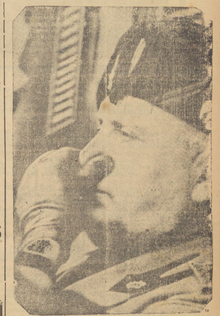
O Duce, que se tornou ferrenho antipatisante das potencias ocidentais desde que foram aplicadas as sanções, pela S.D.N., em consequencia da invasão da Abissinia. Esta expressiva atitude do chefe do governo da Peninsula foi tomada em Berlim, quando de sua primeira visita á capital do Reich.

RIO, 6 (Da Sucursal). — Noticias de Paris dizem que Madame Tabouis escreveu hoje na imprensa francesa que os srs. Hitler e Mussolini teriam um proximo encontro na cidade de Munich.