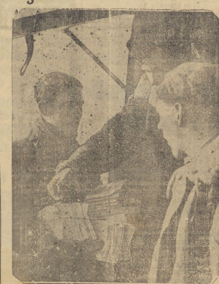
Embora o campo da guerra tenha crescido em limites até o norte europeu, envolvendo a Dinamarca e a Noruega, na frente ocidental continua a guerra de boletins, determinada pelo alto comando inglês. Nesta fotografia vemos um piloto da Real Força Aérea recebendo uma carga de peso antes de partir.