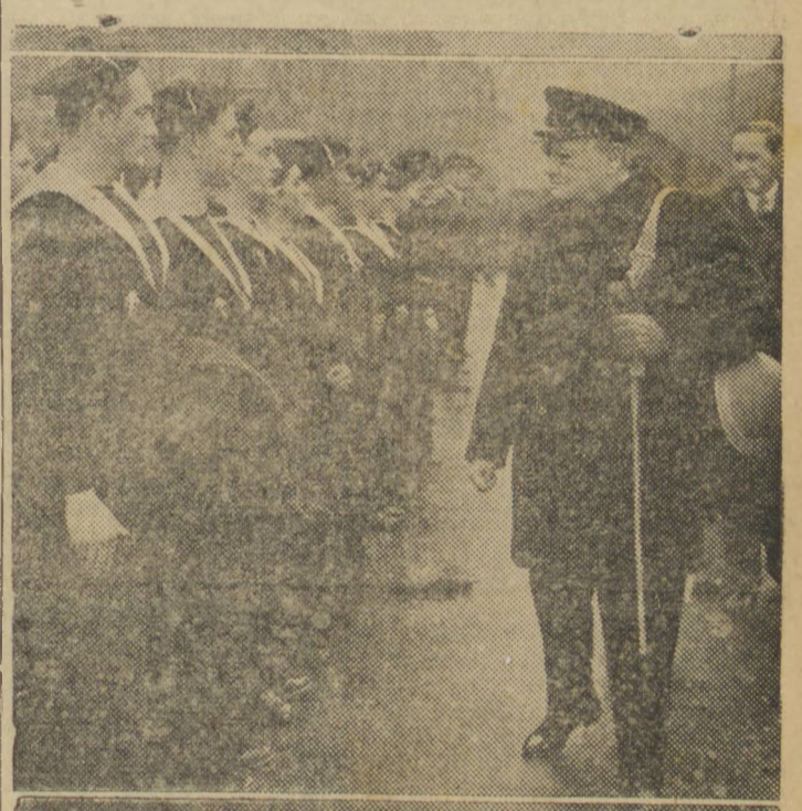
Churchill, 1º Ministro britânico, inspeciona marinheiros gauleses das Forças Francesas Livres que lutam na Síria.

CESSOU A LUTA NA SÍRIA. -- COMUNICADO OFICIAL DO GOVERNO DE VICHY