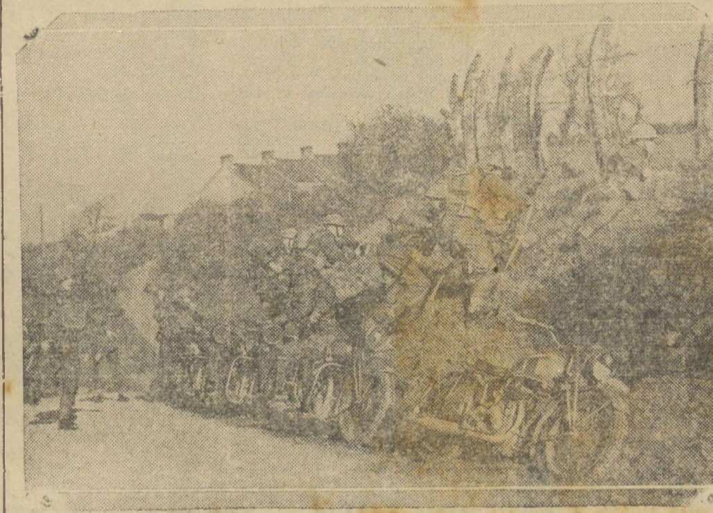
Soldados britânicos no exercício de assalto, preparando-se para o dia da anunciada invasão.

A INGLATERRA DIZ ESTAR QUASI PRONTA PARA INVADIR O TERRITÓRIO INIMIGO