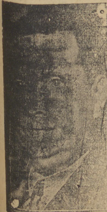
General GOES MONTEIRO

RIO, 11 (Diario) — Irrompeu na madrugada de hoje, um movimento anti-governista, nesta capital, de caracter integralista, tendo os rebeldes atacado de surpresa, o Arsenal da Marinha, chefiados pelo tenente da Armada, Arnoldo Hassemann.