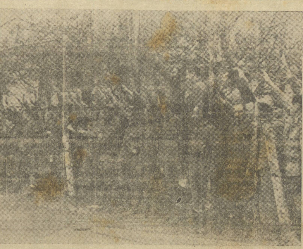
UM FATO RARISSIMO FIXADO POR ESTA PHOTO — Prisioneiros de guerra, num campo de concentração, cumprimentam soldados alemães com a saudação germanica, isto é, com o braço erguido. Trata-se de soldados aprisionados pelos teutos na guerra atual.

Presos varios generais - Detida na Turquia a esquadra francesa - Paris descontente com Vichy