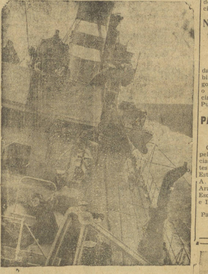
Destroyer inglês, em serviço de patrulhamento contra submarinos. — AO LADO: Um comboio inglês em pleno oceano.

Para uma boa digestão, um calix de BITER AGUIA