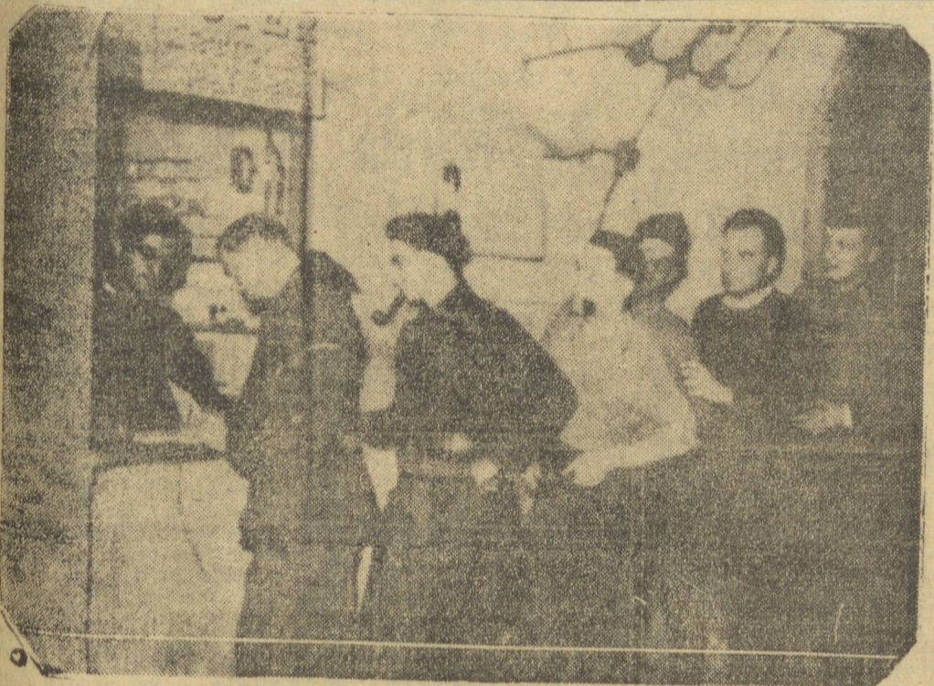
UMA LOJA DENTRO DA LINHA MAGINOT — Os soldados que se vêem no clichê acima estão fazendo compras em um dos pequenos estabelecimentos existentes no interior da famosa linha de fortificações da França. O maximo de comodidade para os "poilus"...