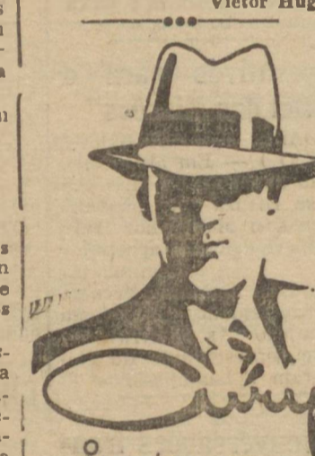
Chapéu dos Quarenta Milhões! Único distribuidor em Guarapuava: "BASAR GUARAPUAVA" o maior varejista da praça

O MILAGRE DO AMOR O amor é como a arvore, nutre-se de si mesmo, lança profundas raízes em todo o torso sér, e continua sempre reverdecendo sobre um coração em ruínas. Victor Hugo