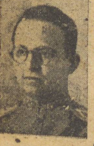
JURACY MAGALHÃES, que se empenha para que a U.D.N. celebre o acordo com o P.S.D.

Um relatório da reportagem do «Diário da Noite» achava-se próximo de ser publicado.