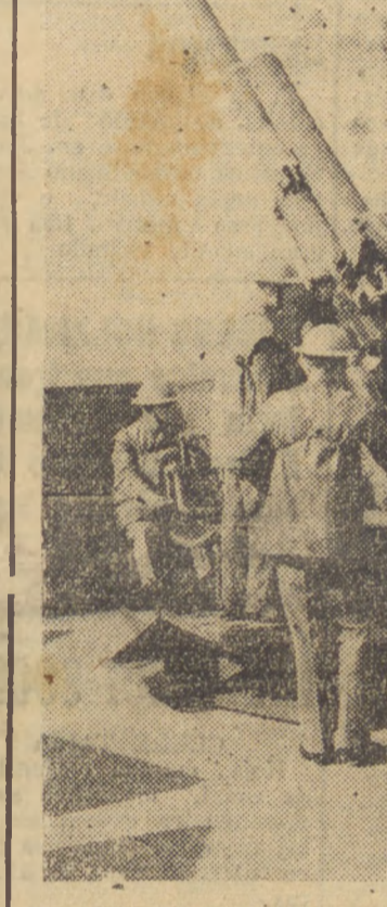
O EXERCITO TERRITORIAL INGLEZ — O Exército Territorial Inglez, creado para operar no caso de uma possível

200.000 homens que dentro em pouco marchará para a frente de combate. Prosseguindo, declarou o comandante supremo dos exercitos aliados que numerosos aviões dos cedidos pelos Estados Unidos á França e á Inglaterra já estão voando