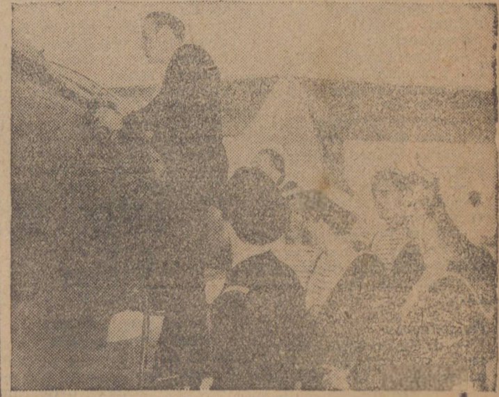
FRANCESES COMBATENTES — Membros das forças da França Combatente que obedecem ao comando do gen. Le Gaulle, realizam atualmente nos E. U. cursos de aperfeiçoamento no manejo dos modernos aviões norte-americanos. Aqui, vemos um grupo desses franceses examinando um poderoso bombardeiro.

formaram que tanto von Rommel como Nehring receberam, durante a semana passada, novos reforços da Sicília e do território continental da Itália, observando que algumas unidades não haviam ainda participado de ações.