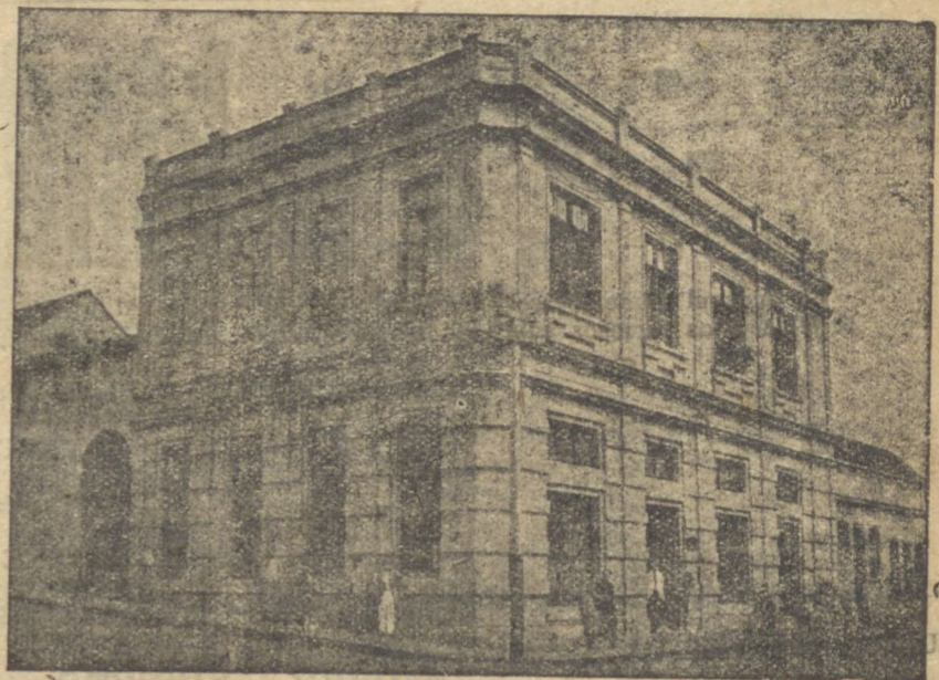
RUA 15 DE NOVEMBRO N. 37 ----- P. GROSSA

Sortimento das melhores marcas de relógio do mundo. Relógio de parede carrilhões de 4-4, desperadores, relógios de bolso Omega, Cyma, Internacional VWatch, Levis, Chronografo para tirar tempo de corridas. Vasto sortimento de relógios de pulso para homens e senhoras. Sortimento de jóias de brilhantes, ouro e platina. Sortimento de artigos para presente em aparelhos para chá, café, etc. Finas canetas tinteiro. Especialista em optica. Lindas imagens de Sastos. Sortimento completo em alianças para prompta entrega. Officina de Relojoaria e Ourivesaria.