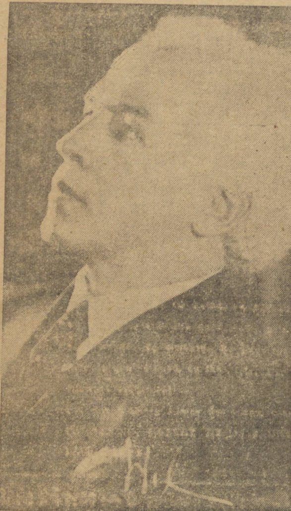
MAESTRO ERNANI BRAGA

Esses dois grandes artistas se apresentarão à nossa culta platéia através de magnífico programa, que executarão amanhã, 16 do corrente, às 21 horas, no elegante auditório do PR-J2.