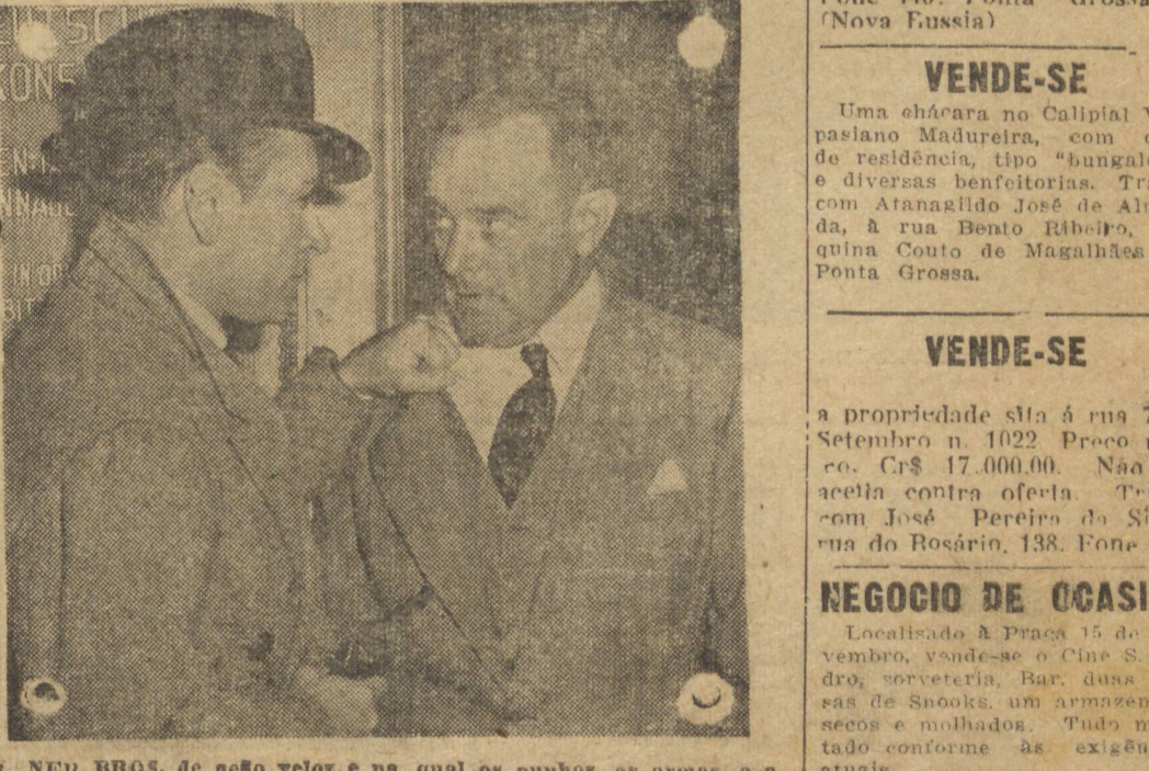
Um drama fortissimo da WARNER BROS, de ação veloz e na qual os punhos, as armas, e o traço trabalham incansavelmente!

DOMINGO EM DUAS SESSÕES Ha intriga, ha amor, ha mistério, ha angustiosas situações e um desenlace formidavel intenso, vibrante, em que saem GEORGE RAFT — BRENDA MARSHALL — SYDNEY GREENSTREET e PETER LORRE BAGDAD STAMBUL