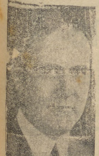
Ministro Oswaldo Aranha

Em termos analogos se manifesta o "Washington News" e outros jornaes de nomeada internacional