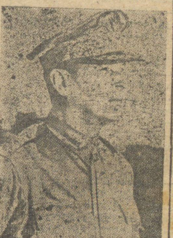
GENERAL MAC ARTHUR

Segundo o acordo ora firmado, os membros das forças armadas, uma vez eleitos para cargos politicos, terão dois caminhos a seguir: ou dar baixa das fileiras, ou renunciar o cargo para o qual forem eleitos.