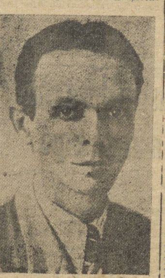
MINISTRO APOLONIO SALES

PORTO ALEGRE, 10 (A.N.) — Informar de Uruguaiana que se realizou ali uma reunião presidida pelo ministro Apolonio Sales e na qual tomaram parte os ruralistas