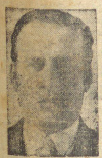
SR. FLORES DA CUNHA