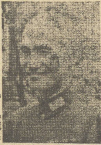
Marechal Chang Kai-Shek

CHUNG KING, Urgente 24 (U.P.) — No discurso pronunciado na reunião conjunta do Conselho Supremo da Defesa Nacional e Comité Executivo Central, Chiang Kai Shek declarou que a China deve reconhecer a independência da Mongólia Exterior e disse que se não deseja enviar tropas para aceitar a rendição dos japoneses na Colômbia britânica de Hong Kong para evitar mal entendido