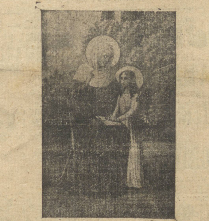
que pode ser conferido a uma coletividade empenhada em seu labor pacífico e construtivo. Que N. S. de Santana recolha essas preces fervorosas e que a exceça Padroeira continue beneficiando esse povo nobre e generoso com as suas bençãos fagueiras, afim de que ele possa continuar cumprindo com a mesma galhardia o seu glorioso destino. Que a augusta Protetora alumine, para tal fim, o caminho que se defronta à nossa comunidade, e que ela alumine, também, todos os corações dos pontagrossenses, limpando-os das discordias estereis e predispondo-os para a confraternização bemfezja e edificante. Que ela nos afaste dos perigos que se delinham nos horizontes brumosos, onde já se vislumbra o entrechoque das ideologias malsãs e negativistas, que tanto contrastem com a nossa vocação cívica que se incrusta em nossas tradições históricas e em nossos corações.

Nem abordará que, sob sua égide dulçurosa, o nosso povo tem vivido através do dobrar dos anos no clima celestial que tem trazido às almas o calor dos mais tré-