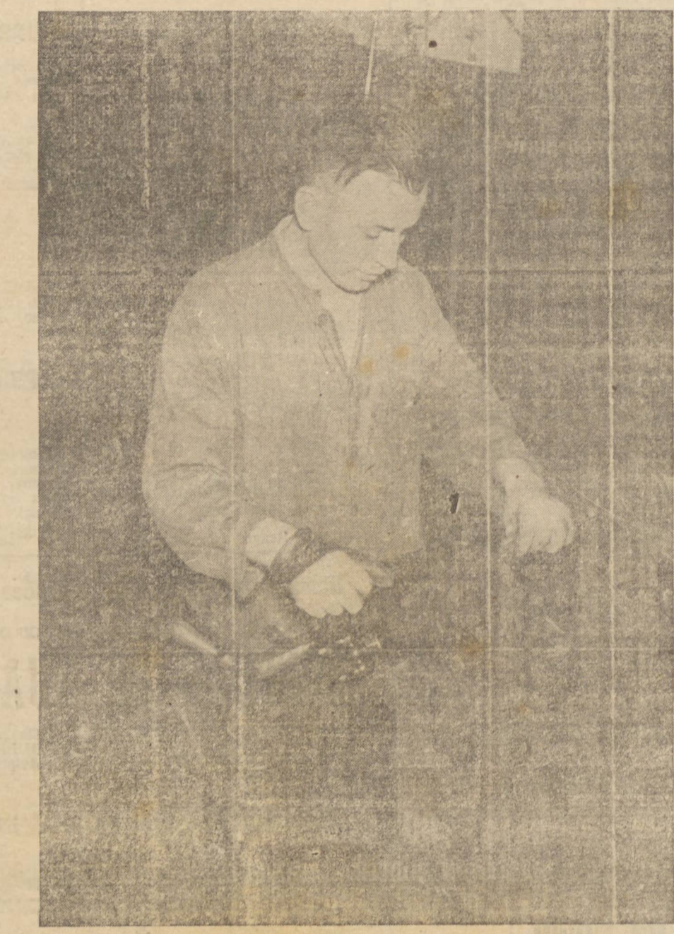
Apesar do grave ferimento sofrido na mão, esse operário de poder exercer o seu oficio como mecânico, graças a um se submeteu.

ISTAMBUL, 6 (T.O.) — A emissora de Teerã desmentiu a noticia difundida, de fonte não confirmada, pelo radio de Angorá, de que se havia demitido o primeiro ministro do Irã, sr. Ali Furughi.