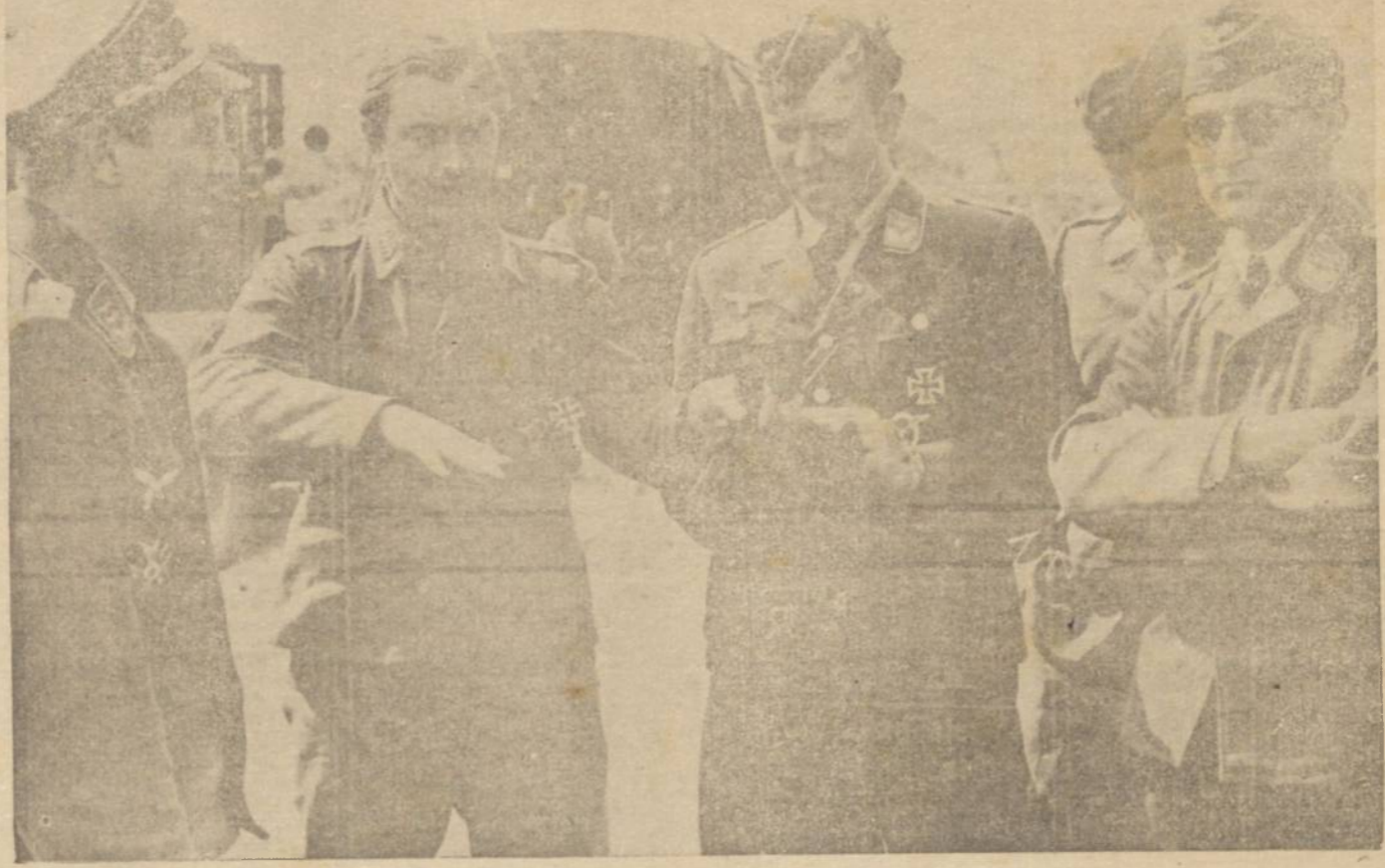
Aviadores da Luftwaffe relatam as suas aventuras.