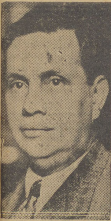
General Góes Monteiro

RIO, 21 (D) — "O Globo" assevera que se está procedendo a uma conspiração, nesta capital, com o fim de se restabelecer a ditadura.